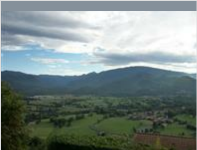
TABLE D'ORIENTATION DU CAP DE LA COSTE