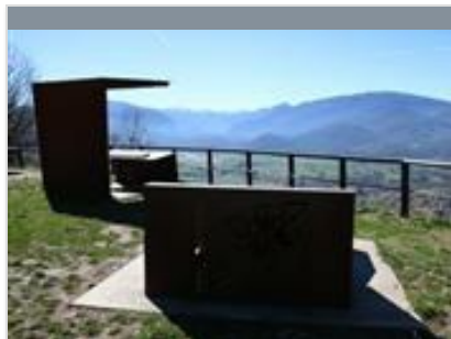
TABLE D'ORIENTATION DU CAP DE LA COSTE