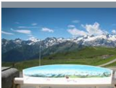
TABLE D'ORIENTATION DE SUPERBAGNÈRES